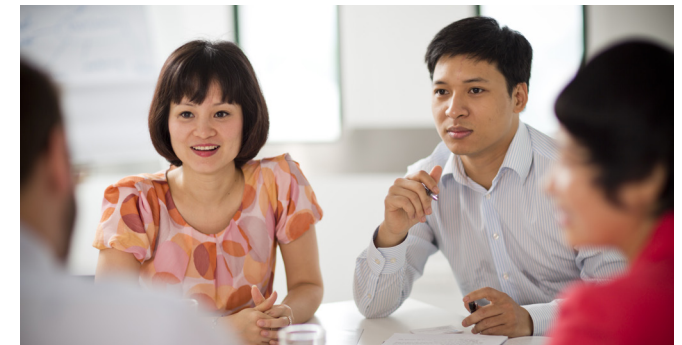
หลักสูตรทักษะการสื่อสารอย่างมืออาชีพ สอนในรูปแบบเวิร์กช็อปเชิงอินเตอร์แอคทีฟที่เข้มข้น