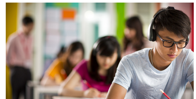
การสอบเพื่อวัดระดับภาษาก่อนฝึกอบรม การสอบระหว่างหลักสูตรเพื่อวัดความก้าวหน้า และการสอบประเมินผลหลังหลักสูตรสำหรับใบรับรองและประกาศนียบัตร