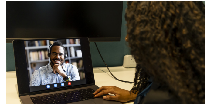
ชั้นเรียนออนไลน์ สอนโดยครูผู้เชี่ยวชาญของบริษัทเคานซิล เรียนในรูปแบบกลุ่มหรือตัวต่อตัว